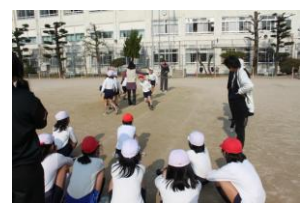
長縄大会(体づくり)