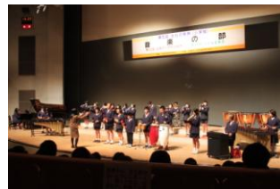
広島市小学生音楽祭