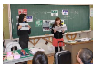
6年生 租税教育。ゲストの2名の税理士さんから、税金について学びました。