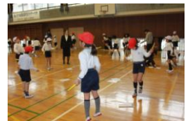
なわとびチャレンジ中！