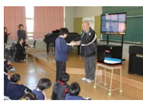
校内書き初め大会 表彰。各学年3名程度が入賞しました